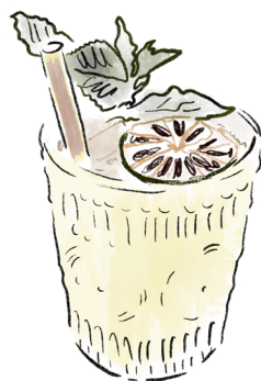
YUZU BAMBOU 25cl .....21€

La recette signature inspirée par l'énergie de «Tante Yaya». Un cocktail qui commence en douceur et finit sur des notes joyeuses et secrètes. Le mélange idéal pour des moments mémorables. »