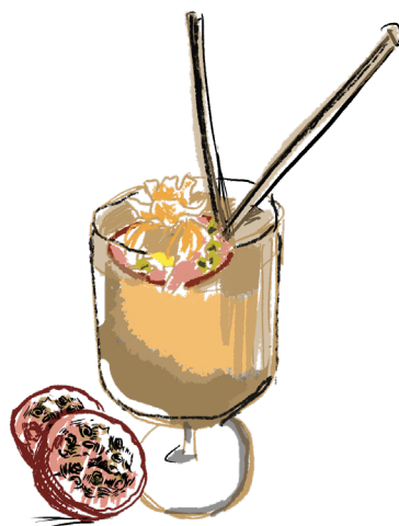
JAMAÏCAN STAR 40cl .....19€

Une base de vodka et Cointreau relevée par un zeste de citron vert, le tout adouci par l'élégance de l'hibiscus. Un mélange frais servi dans un verre à martini pour un voyage sensoriel raffiné. »