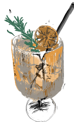
PAMPLEMOUSSE SPRITZ 40cl .....19€

Le cocktail iconique réinventé pour vos soirées à Cabane. Une explosion de saveurs au café, déclinée en trois variations gourmandes : Caramel sel de mer, Chocolat velouté ou Noix de coco exquise. »