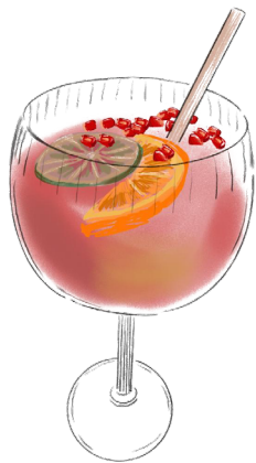
GRENADA SPRITZ 20cl .....21€

Certains de nos cocktails peuvent être déclinés en version virgin