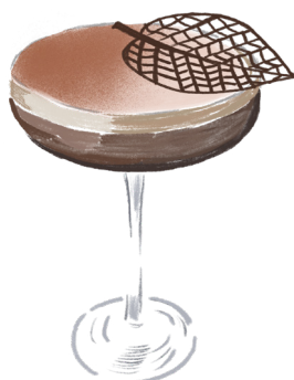
NOS EXPRESSOS MARTINI 20cl .....19€